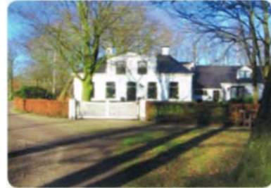
Voormalige Pastorie Kortland

opgesloten door een strook keitjes. Direct na de derde weg rechts volgt een onverhard pad, Kortlandsweg (Doemniespad'). Hier RA. Daarna het pad links van de voormalige Pastorie 'Kortland ' volgen